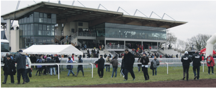
Sept réunions hippiques seront organisées sur l'hippodrome du Pôle du Cheval et de l'âne en 2013. Outre de nombreux rendez-vous équestres d'envergure nationale ou internationale, le site ouvrira de nouveau ses portes à des sportifs d'un tout autre genre en 2014 en recevant le championnat de France de cyclo-cross FFC.